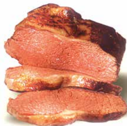
"Roast-beef" Cocinado al vacío con CSC