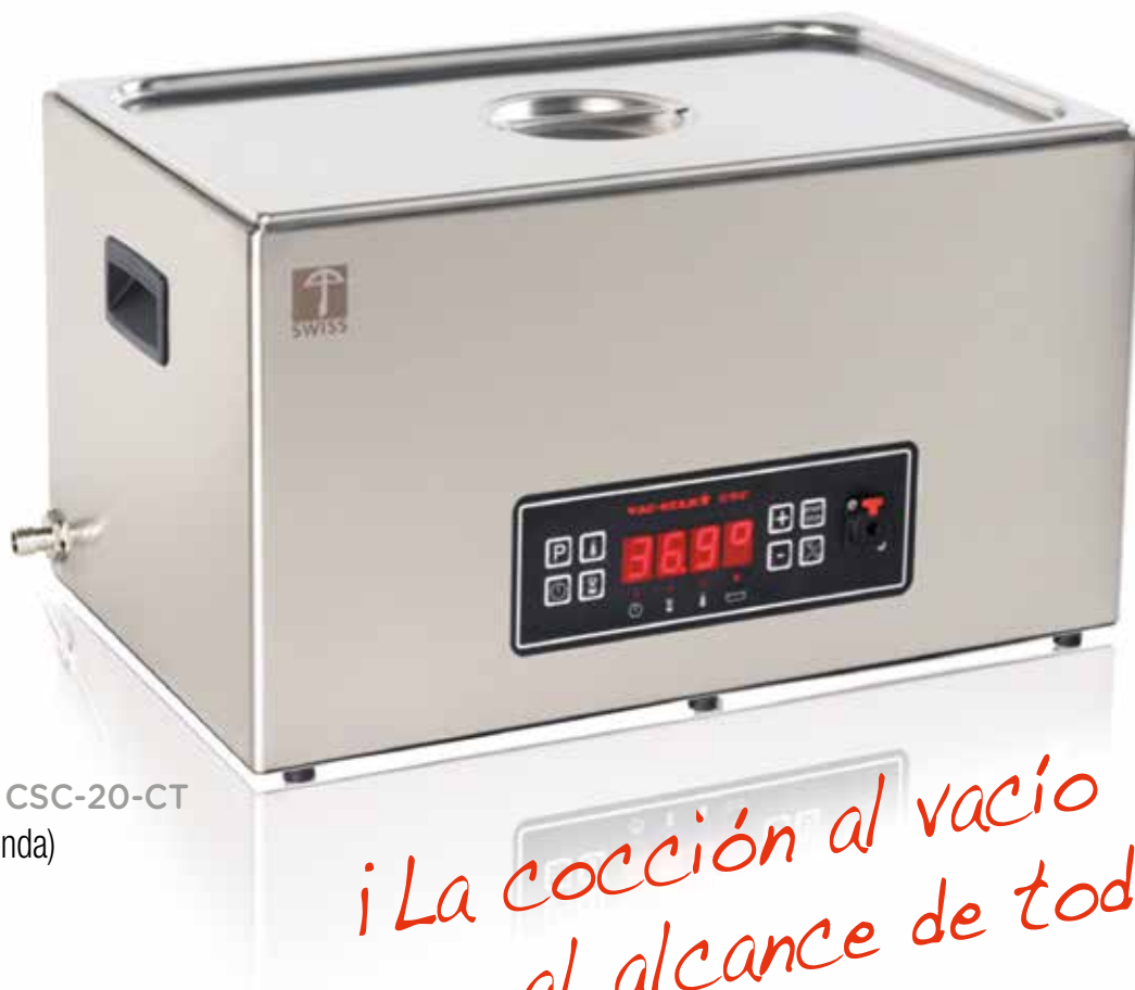
MOD. CSC-20-CT (Con sonda)

¡La cocción al vacío al alcance de todos!